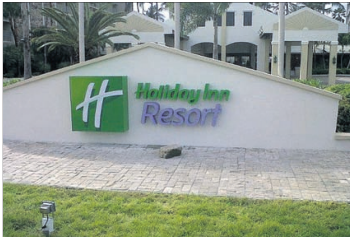
Borchi nan na entrada di e resort lo ta ilumina pa luznan LED pa crea un efecto resaltante.